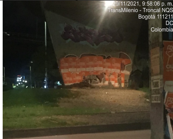
Fotografía No. 6

29/11/2021, 9:58:06 p. m. TransMilenio - Troncal NQS Bogotá 111211 DC Colombia