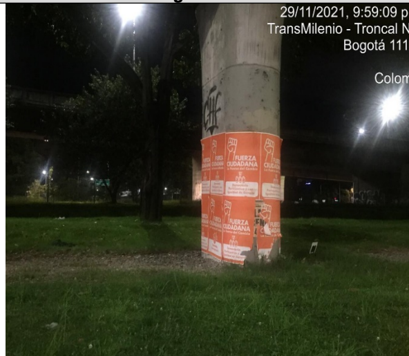
Fotografía No. 8

29/11/2021, 9:59:09 p. m. TransMilenio - Troncal NQS Bogotá 111211 DC Colombia