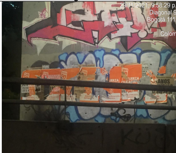
Fotografía No. 7

29/11/2021, 9:58:29 p. m. Diagonal 92 53-99 Bogotá 111211 DC Colombia